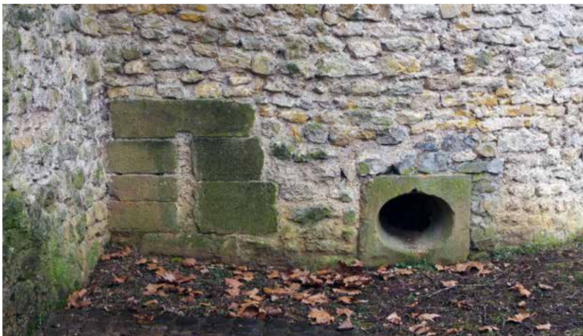
5 – Archère murée (XIII e siècle) et canonnière installées côte à côte sur la tour de la Cité n° 2.