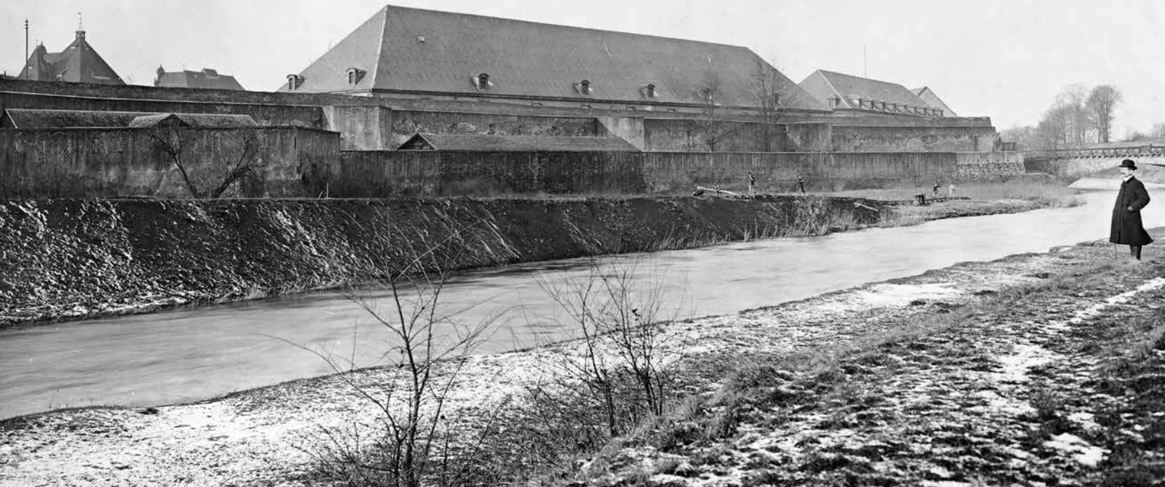
3 – Mur en Chadeleirue en cours de remblaiement en 1904.

calcaire jaune dit «de Jaumont», matériau local qui était extrait, d’après les sources de la seconde moitié du XV e siècle 4 , dans les carrières du mont Saint-Quentin. Ces dernières appartenaient à la cité et étaient situées à quelques kilomètres à l’ouest de Metz.