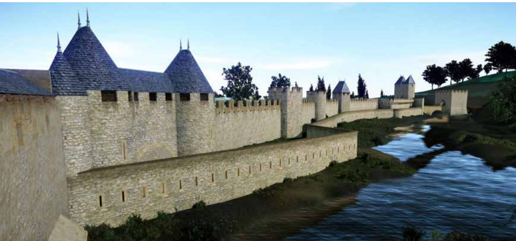
6 – Essai de restitution de la portion en Chadeleirue au milieu du XVI e siècle. Au premier plan, la poterne murée. Au dernier plan, la porte Sainte-Barbe et son ouvrage avancé. Infographie Nicolas Gasseau, Historia Metensis.

En mars 2013, l'association Historia Metensis a poursuivi son travail de relevé de l'enceinte de Metz entreprenant l'étude de la fausse braie située au nord de la porte des Allemands, sur laquelle a été construite la caponnière Desch.