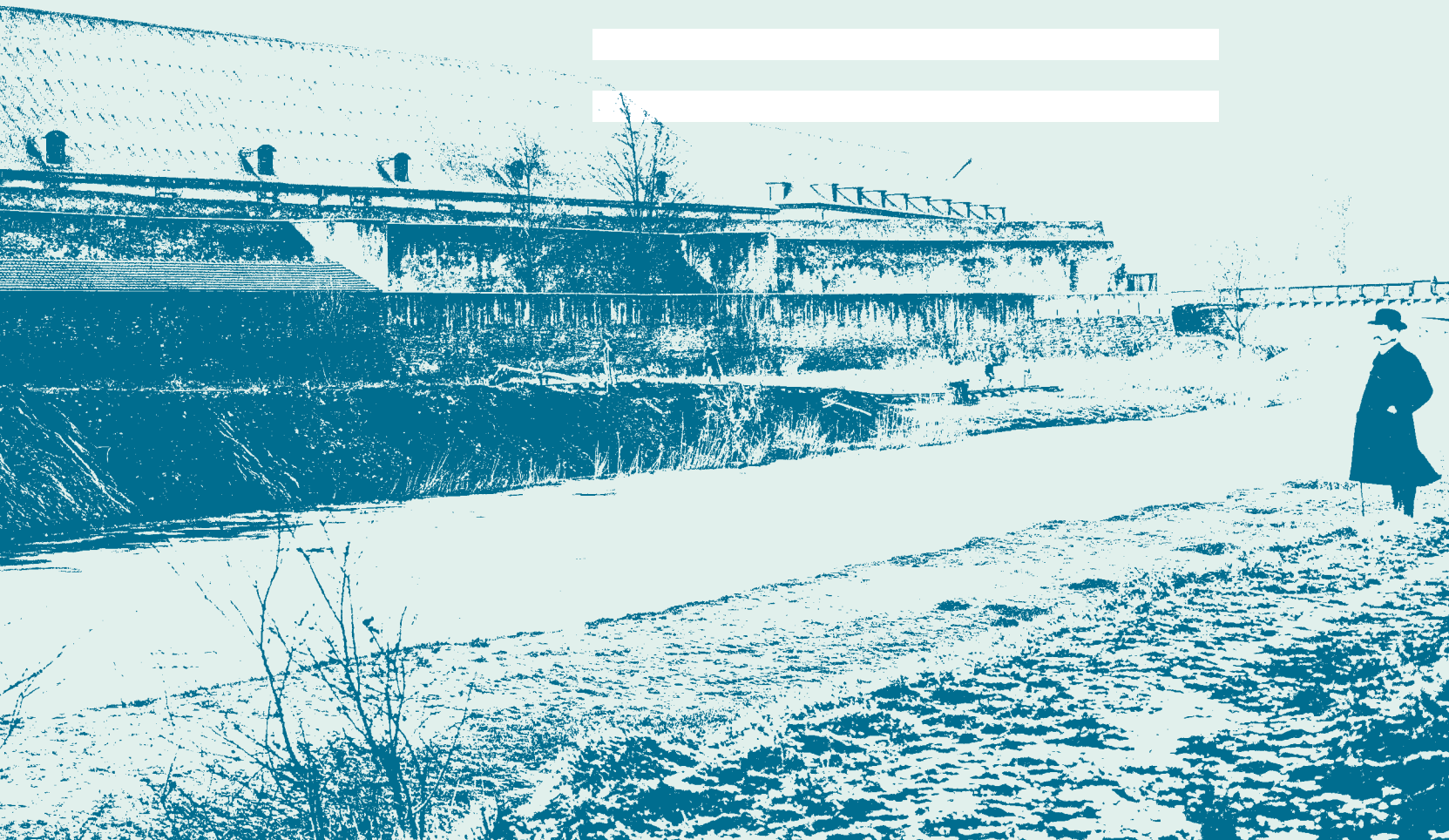
1 – Vue générale du tronçon relevé en 2012 entre la poterne en Chadeleirue et le pont Sainte-Barbe.

Étude archéologique et historique de l'enceinte médiévale (deuxième partie)