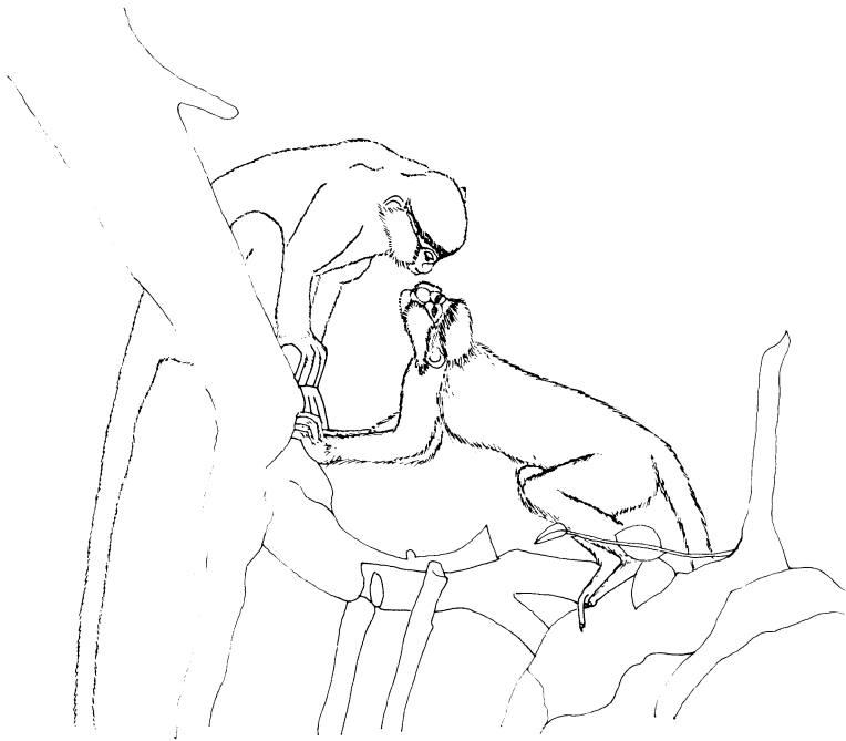
Figure 1. — Flairage nez-nez entre le mâle adulte GM (à gauche) et le mâle subadulte PN (à droite), montrant la différence de taille entre les deux individus. Dessin d'après photo.

Enfin, le mâle adulte GM (le « master male » de Haddow 1952) se tenait généralement à l'écart du reste de la troupe, en compagnie du mâle subadulte PN (figure 1). Ce dernier participait