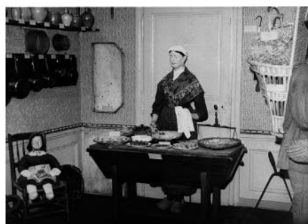
Illustration 3 : une pièce du Musée du Peuple Messin