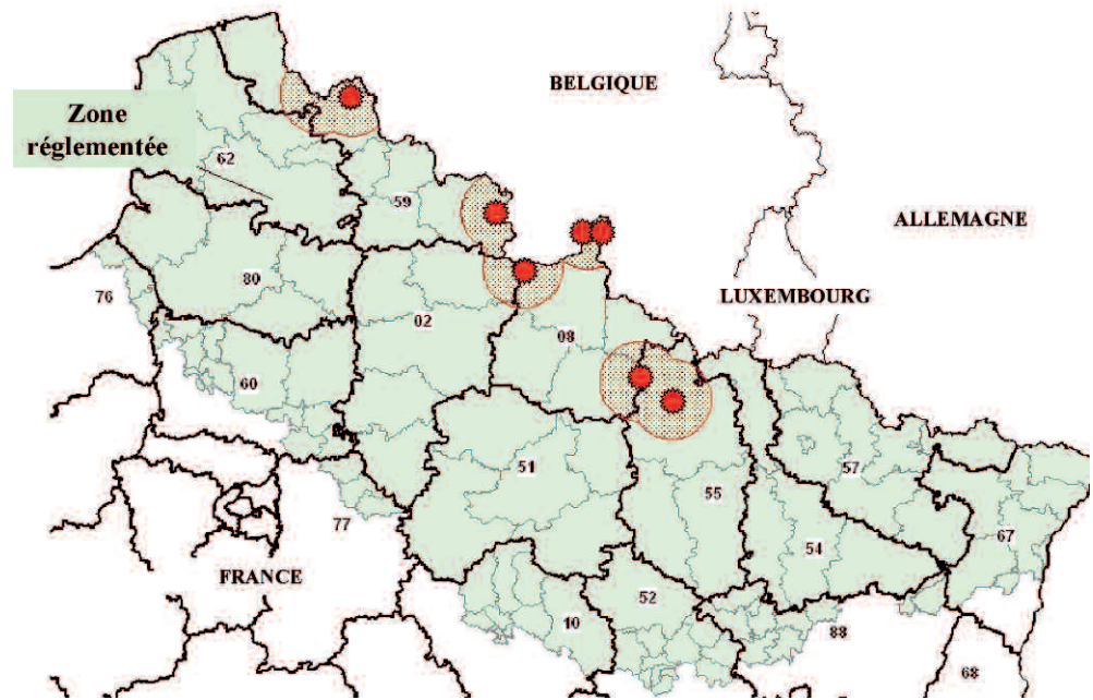
Figure 1 : Localisation des 7 foyers de bluetongue sérotype 8 dans le nord de la France au 15 janvier 2007.