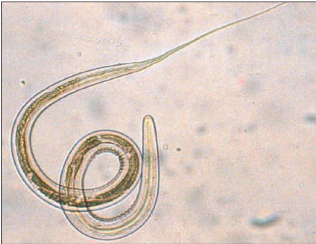
Figure 1 : Cliché montrant une larve infestante de Nematodirus battus . La gaine (deuxième cuticule conservée lors de la dernière mue) est bien visible, en particulier à l'extrémité postérieure de la larve (« queue de la gaine »). Cette queue de gaine très longue est caractéristique du genre Nematodirus . L'enroulement de l'extrémité antérieure de la larve montre les plis de cette gaine. Les zones plus sombres à l'intérieur de la larve correspondent aux « cellules intestinales », véritable tube digestif du nématode.