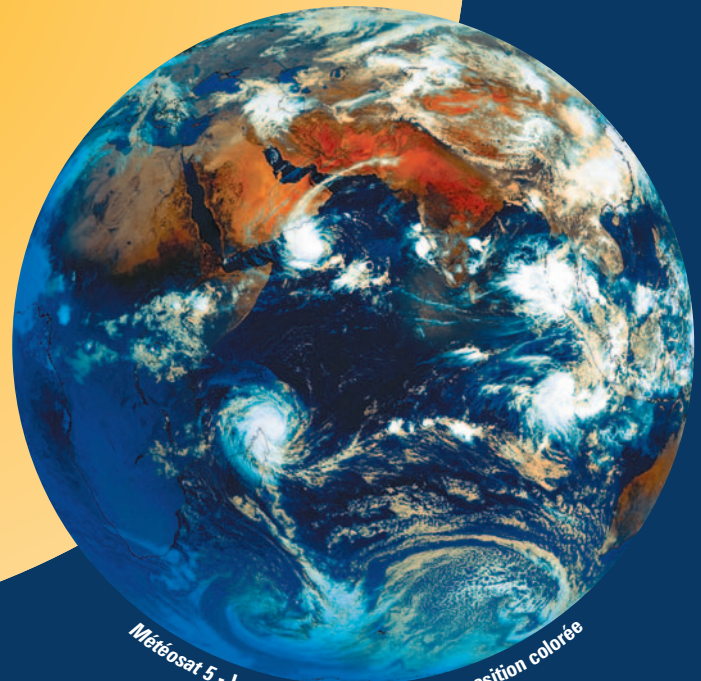
Météosat 5 - Le 09.05.02 à 6 h UTC - Composition colorée