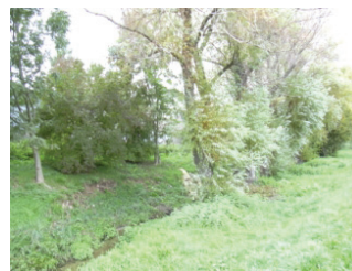
Hétérogénéité du milieu physique : tronçon banalisé, ripisylve intéressante (Grand Nancy)

Cet état des lieux a conclu à une grande diversité de sections. Sur certains tronçons, le milieu est banalisé et offre un potentiel de biodiversité réduit (ripisylve absente, recalibrage des berges...). Cependant, certaines sections du ruisseau comportent une ripisylve d'une grande qualité paysagère, témoin de la potentialité de revalorisation du ruisseau. Enfin, des tronçons du ruisseau sont recouverts et pourraient être remis à ciel ouvert.