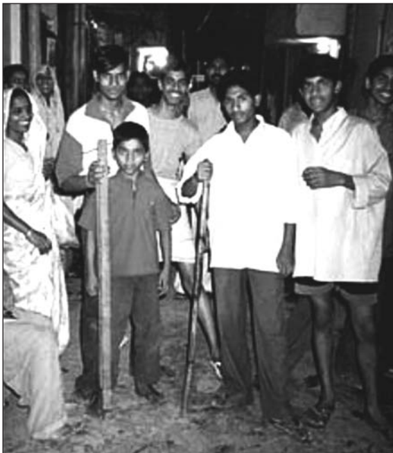
Une journaliste américaine, présente sur les lieux, saisit une des scènes de chasse à l'Homme-singe où la population est à la fois inquiète et hilare... © Celia W. Dugger, The New York Times, 2001

balcon de sa terrasse. La nuit suivante, des milices d'hommes et de mômes, hérissés de lances et de bâtons où ils ont lié lames de couteau, tessons de bouteilles, veillent sur les champs d'ordures, les murets des toits-terrasses. L'histoire s'enjolive à chaque témoignage. L'homme singe prend ses formes dans l'imagination populaire. Le 2 mai, le quotidien hindi Amar Ujala rapporte que des résidents massés sur un terrain vague ont aperçu « une ombre noire d'apparence simiesque ». La terreur se cristallise. Le 10 mai, les autorités politiques de Ghaziabad donnent consigne aux forces de l'ordre : elles doivent tirer à vue sur la bête. Le 13 mai, l'homme singe apparaît dans les quartiers pauvres de New Delhi. La créature est devenue « cyborg » entre-temps, robot électronique aux iris verts, phosphorescents, doté de pouvoirs surnaturels, téléguidé les services secrets pakistanais ! La créature fait des bonds dantesques : des ressorts aux pieds lui permettent de sauter les immeubles. Mieux, il évolue dans les airs grâce à des boutons de direction sur sa ceinture de couleur verte. Singe virtuel il a le pouvoir de se rendre invisible. Grâce aux crochets d'acier, en guise de doigts, il agrippe, emporte ses proies humaines vers les cieux.