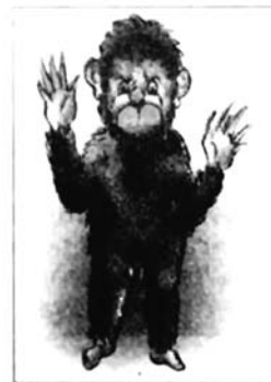
The police say the creature is 4'6", wears only a dark coat of hair

« La rumeur s'étant momentanément calmée dans les banlieues, le mal devait se propager à New Delhi ». Manoj Lall, le chef de la police des quartiers Est, confirme : « Cataclysmique ! Journaux, télévisions, radios instillaient en temps réel la moindre info en temps réel, vraie ou supposée. Des Monkeymen partout plongeaient les quartiers populaires dans le chaos »... Normal. Des centaines de « factories », petites manufactures sous-traitantes des firmes internationales se sont installées là. Elles fabriquent des pièces détachées, des accessoires automobiles ; pièces de rechange pour frigos, télévisions, multimédia ; jouets, vaisselle, bibelots, sandales... Tout en matière plastique. Chaque jour des dizaines de milliers de travailleurs de l'Uttar Pradesh se courbent quatorze heures par jour, sur les chaînes d'emboutissage. Boulot harassant, ponctué d'accidents souvent mortels causés par l'absence de toutes mesures d'hygiène et de sécurité. Les ouvriers embauchent