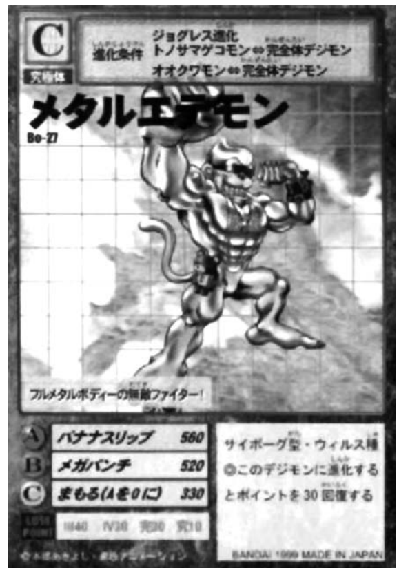
Bandai, 1999. Cartes Digimon