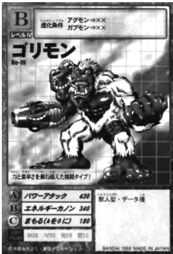
Bandai, 1999. Cartes Digimon