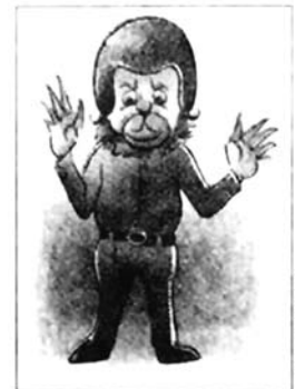
Eyewitness says it is 5'6", wears black and sports a helmet, with shining red eyes