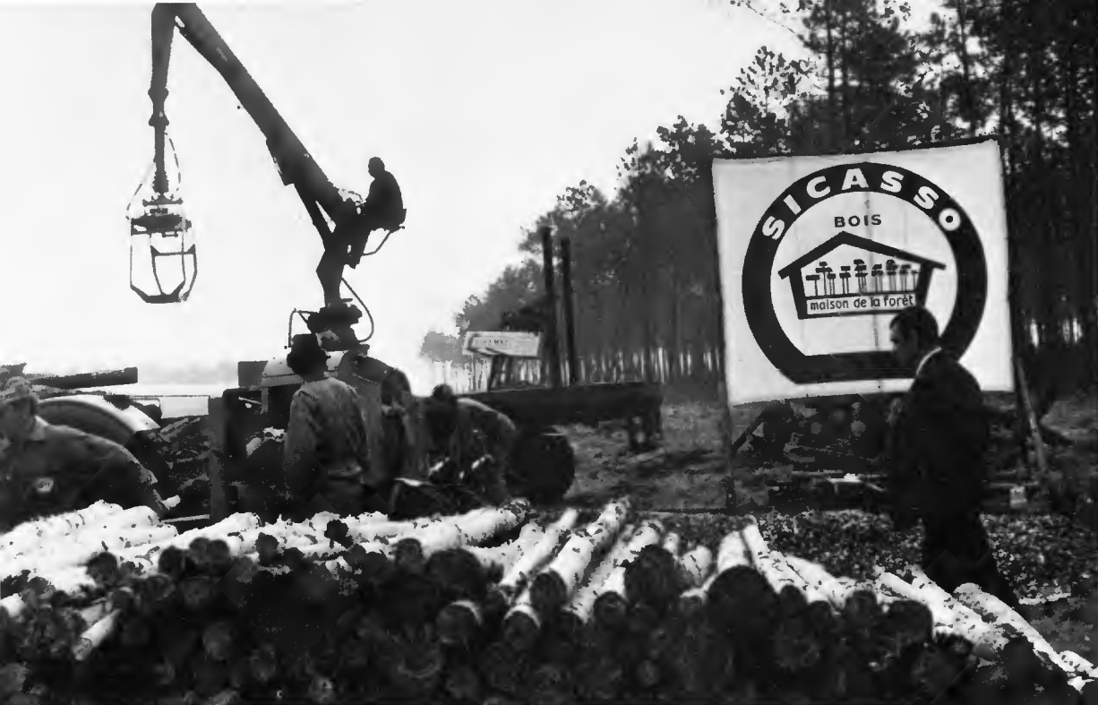
La Sicasso-Bois aide les propriétaires à commercialiser leurs bois

• Le département « Sylviculture » réalise pour les sylviculteurs tous les travaux sylvicoles, depuis la mission ponctuelle (dépressage, reboisement, débroussaillage, plan simple de gestion, etc.) jusqu'à la gestion complète de propriété, grâce à une équipe complète d'ingénieurs et de techniciens.