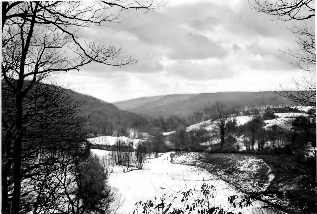
Enclave de la Bouteille depuis la route forestière des VAUVES